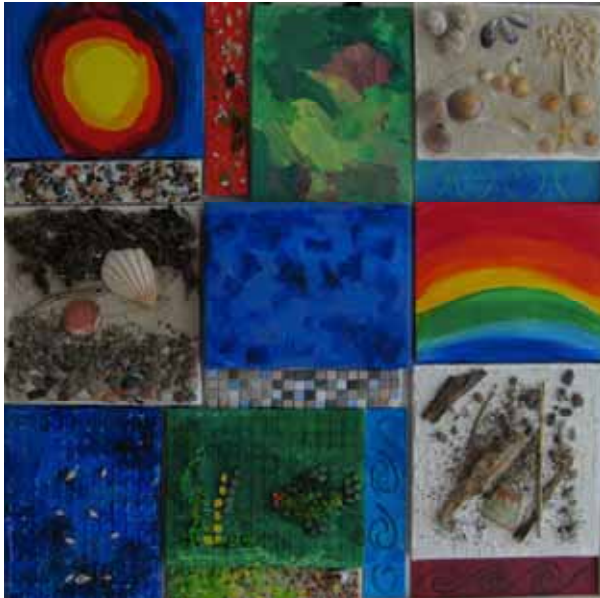
Gemeinschaftsarbeit Alt-Schönow 2009