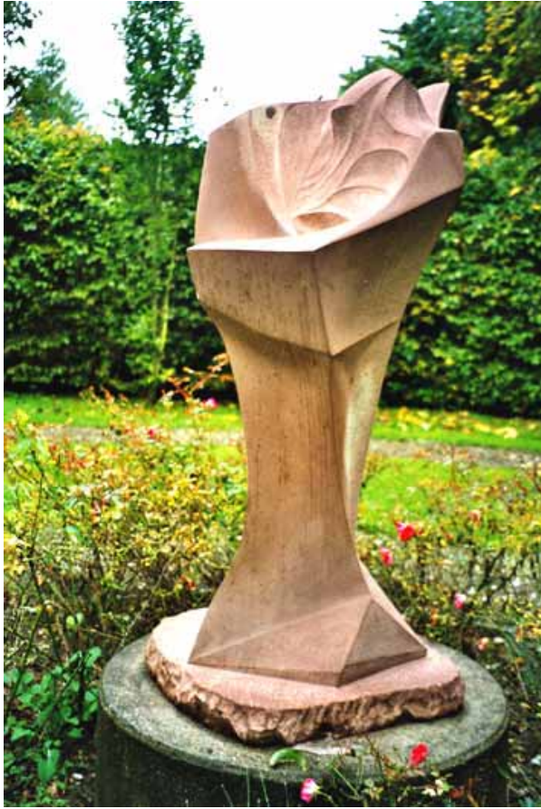
Statue, Friedhof Hermannsberg

Zu Michaeli werden meine Erträge gewogen. Mein Engel trägt sie auf die Waage des kleinen Todes und ist betrübt oder glücklich – je nachdem, was ich mit meinem Jahr gemacht habe.