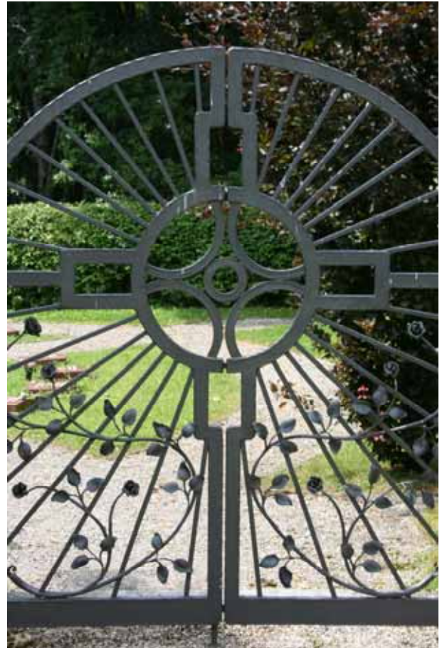
Friedhofstor am Hermannsberg

Viele Eltern der Hermannsberger Betreuten haben bereits schon jetzt die Stiftung mit der späteren Bestattung ihrer Angehörigen beauftragt.