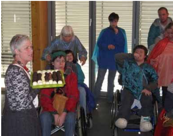
Nach der Eurythmie-Aufführung

Ich habe die Tagung sehr genossen, der Rahmen und die Organisation haben überzeugt und ich denke, dass sie auch gerade bei den jungen Vertretern ein reges Interesse an dem Thema oder den Themen der Tagung geweckt hat.