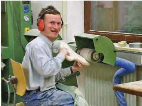
In der Schreinerei

FREUNDESKREIS CAMPHILL e. V. Argentinische Allee 25 14163 Berlin Tel. 0 30/ 80 10 85 18 Fax.: 0 30/ 80 10 85 21 E-Mail: info@fk-camphill.de