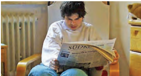
beim Zeitung lesen

Der Name Camphill steht für eine sozialtherapeutische und heilpädagogische, anthroposophisch orientierte Lebensform: Menschen mit unterschiedlich hohem Assistenzbedarf lernen, leben, und arbeiten in Schul-, Dorf- und Stadtgemeinschaften, in unterschiedlichen Wohnformen.