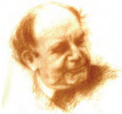
Dr. Karl König , 1902 - 1966

Es hat sich gezeigt, dass hier ein sehr großer Gesprächsbedarf besteht und der für das Treffen angesetzte Zeitrahmen von 1,5 Stunden bei weitem nicht ausreichend war, so dass auch das in der Einladung für das Treffen angedachte Thema „Aufgaben und Pflichten des gesetzlichen Betreuers“ nicht mehr behandelt werden konnte und auf das Treffen im nächsten Jahr verschoben werden musste.